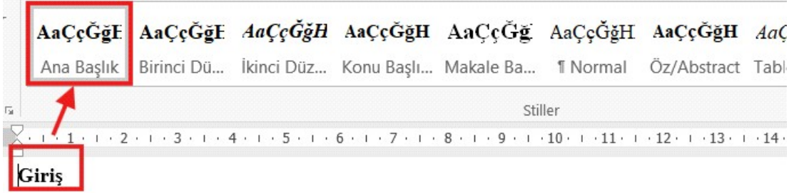
Ana Bölüm Başlıkları Özel Stili

4. Birinci, ikinci ve üçüncü düzey başlıkları oluşturmak için söz konusu başlık stilleri seçilmelidir. Üçüncü düzeyden sonra alt başlık kullanılmamalıdır.